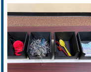
Cuadro de secuencia