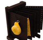
Libro de objetos